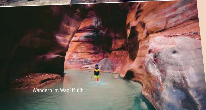
Wandern im Wadi Mujib