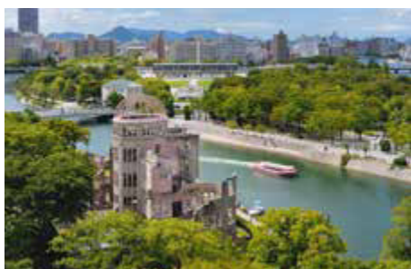
A-Bomb Dome, Hiroshima

können bereits abends an einer ersten Andacht teilnehmen. (F A)