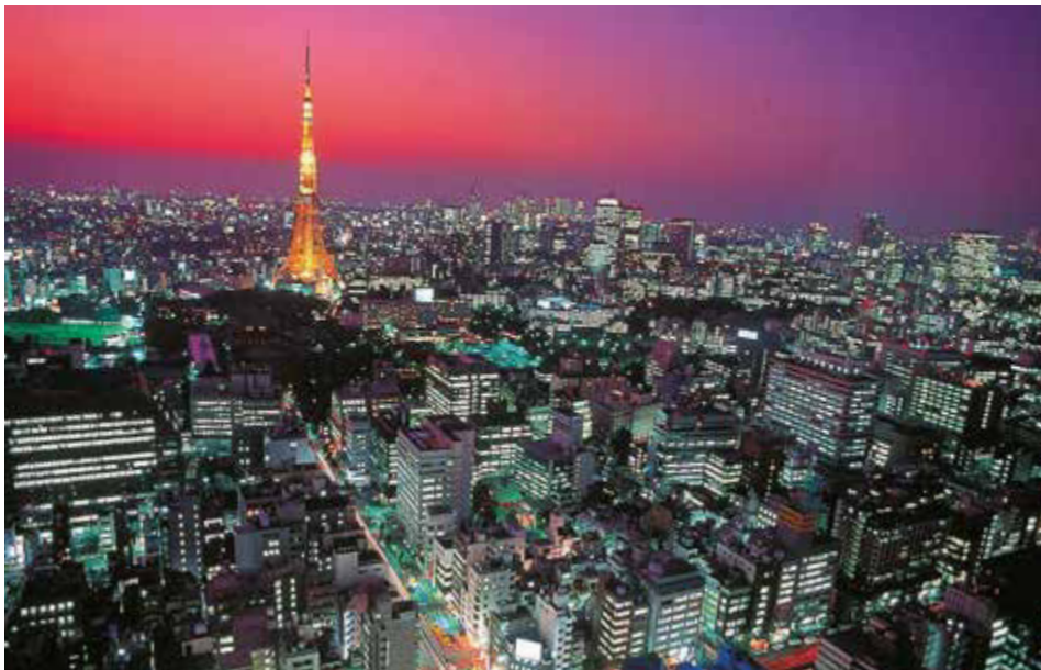
Tokyos Skyline bei Nacht

z. B. 17-tägige Bahnreise durch das Land des Lächelns