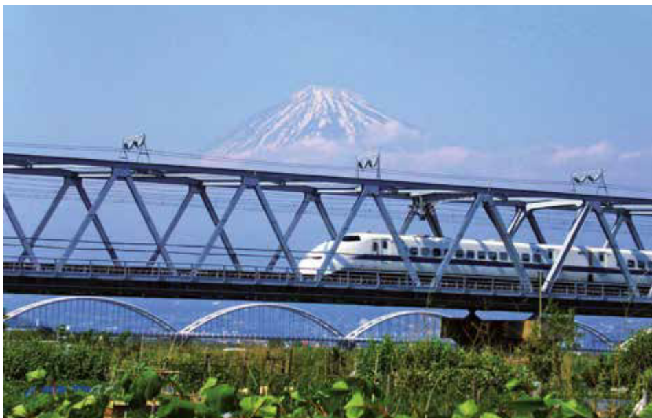
Shinkansen-Zug vor Mount Fuji